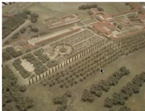
- DISEÑO DE JARDINES URBANOS - CAVERA - AÑO 2022 -