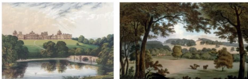
- DISEÑO DE JARDINES URBANOS - CAVERA - AÑO 2022 -